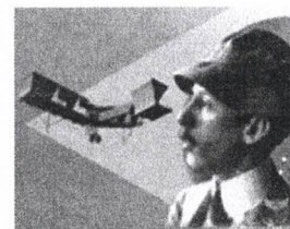
TERRA DE SANTOS DUMONT

alunos de nível fundamental, médio e superior e de cursos técnico e tecnológicos, quando nos municípios em que residam não haja instituições educacionais com aulas presenciais legalmente reconhecidos.